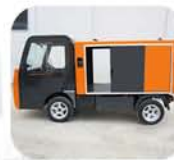
Cajon de poliestere cerrado.