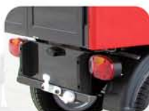
Topes de caucho y bola remolque.