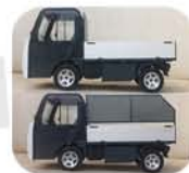
Caja de aluminio abierta con laterales