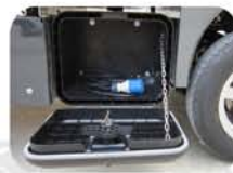
Cajón de herramientas de plástico.